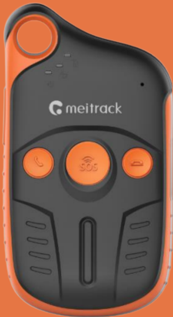
EQUIPO PORTATIL: P99G/P99L (CORREA)