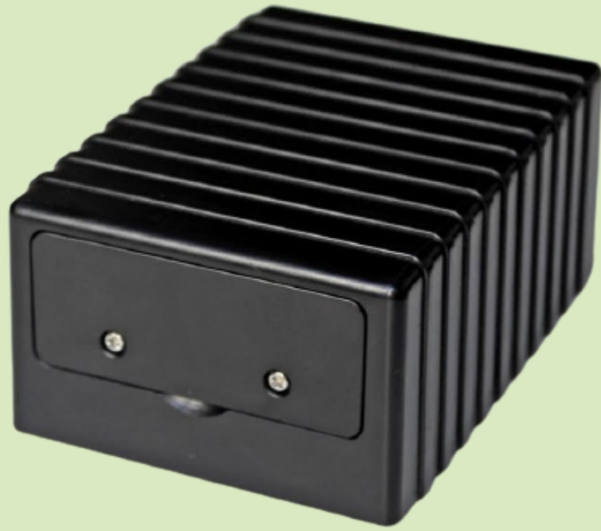
EQUIPO PORTATIL: T355 (IMÁN)